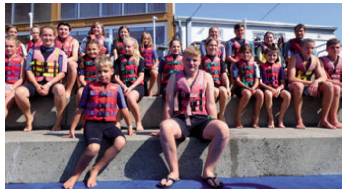
Wasserski fahren auf dem Gufi-See