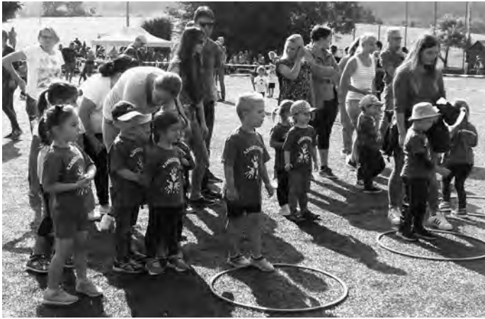
Mit großer Freude bewältigten alle ihre Aufgaben. Herzlichen Glückwunsch euch allen, ihr ward einfach spitze.