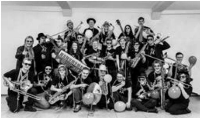
Die Big Energy Band wird mit ihrem BigBandParty!-Programm die Bühne zum Beben bringen.

Wer interessiert ist, was sich im Bereich »Jazz-Rock-Pop« bei jungen Musikerinnen und Musikern in der näheren Umgebung so alles tut, der sollte unbedingt kommen. Achtung - mit eventuell auftretenden rhythmischen Körper-Zuckungen muss gerechnet werden, zu Nebenwirkungen fragen Sie Ihren Arzt oder Apotheker ☺