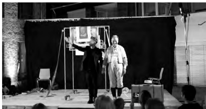
In der lauen Sommernacht.