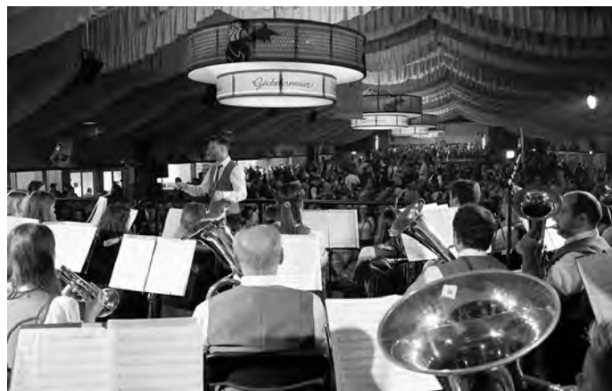
Die Musiker auf einer der zwei Bühnen.