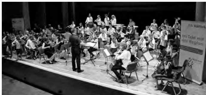
Großes Orchesterkonzert - zum 50. Geburtstag der Musikschule!

50 Jahre Musikschule - feiert das Jugend-Sinfonieorchester am Samstag, den 25. Mai um 19:30 Uhr in der Jahnhalle Geislingen mit einem großen Orchester-Konzert! Der Klangkörper wird dabei verstärkt durch viele ehemalige Mitglieder. Die Nachwuchsensembles »Paganinis« und »Maxis« sowie die preisgekrönte »Fiddle-Band« heizen im ersten Teil der Veranstaltung ein.