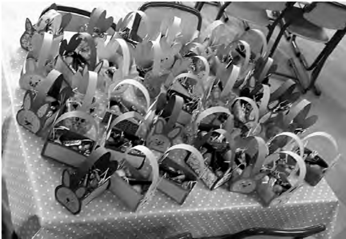
Die gefüllten Osterkörbchen