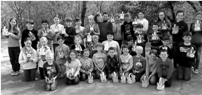
Betreuungskinder mit den Osterkörbchen