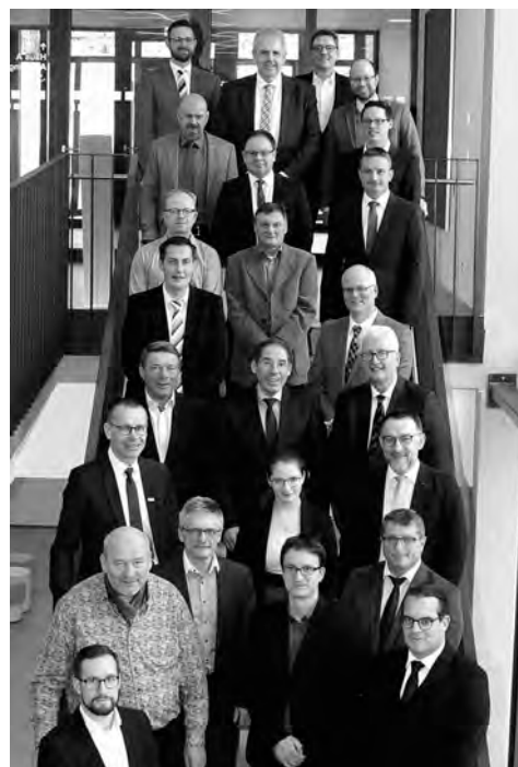
Die Bürgermeister und Breitbandbeauftragten der Städte und Gemeinden unterzeichneten im Landratsamt die Netzbetriebsverträge mit der NetCom BW.