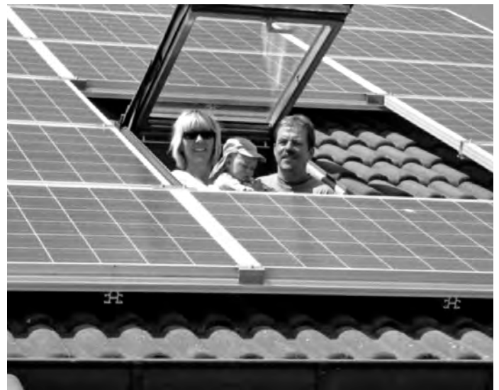
Aufgrund sinkender Modulpreise lohnt sich eine PV-Anlage trotz sinkender Einspeisevergütung

Um Anmeldung mit Angabe der Personenzahl wird gebeten: Tel.: 07161 65165-02, E-Mail: d.seck@landkreis-goepplingen.de