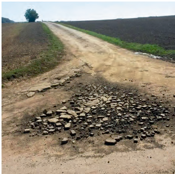
Vor der Erneuerung