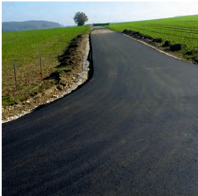
Nach der Neuasphaltierung