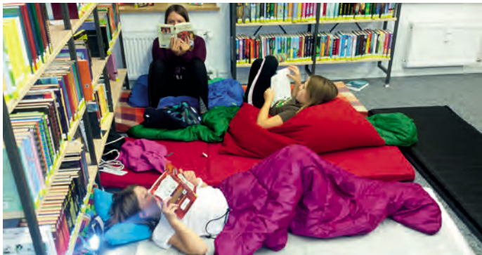
Lesenacht in der Bibliothek