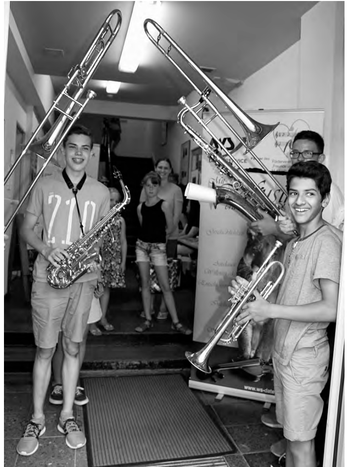
Willkommen in der Musikschule - beim Tag der offenen Tür!

Musik machen fordert und fördert Hirn, Herz und Hand - dass diese Kombination für die gesamte Entwicklung eines Menschen schlichtweg ideal ist, ist heute kein Geheimnis mehr. Der enorme Wert dieser Tätigkeit ist wissenschaftlich bewiesen. - Die Musikschule Geislingen bietet dazu ein breitgefächertes und qualifiziertes Angebot.