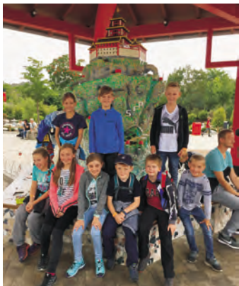
Legoland mit der Freiwilligen Feuerwehr Treffelhausen