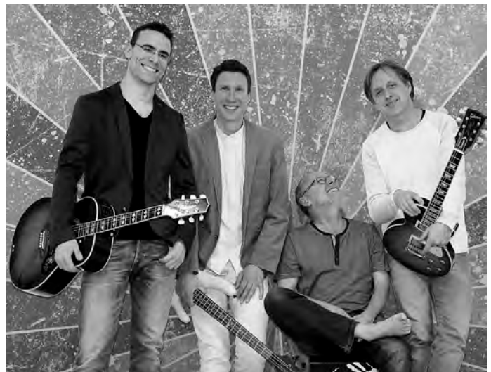
Vier Lehrkräfte der Musikschule könnten Väter & Söhne sein - und machen gemeinsam Musik aus den späten 1960er Jahren.

Der Eintritt ist frei, Spenden werden dankbar entgegen genommen.