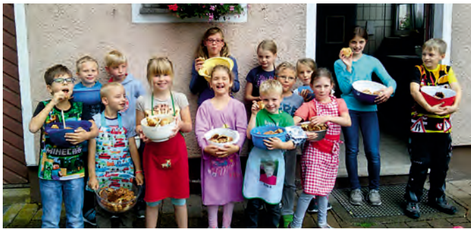
Herzhafte Brötchen am 31.08.2018 mit den Landfrauen Steinenkirch