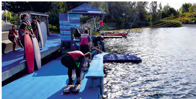
Ausflug an den Gufi-See: Wasserski & Wakeboard fahren mit dem Freien Jugendclub