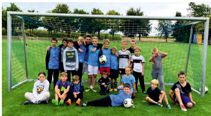
Tag des Kinderfußballs mit der TG Böhmenkirch