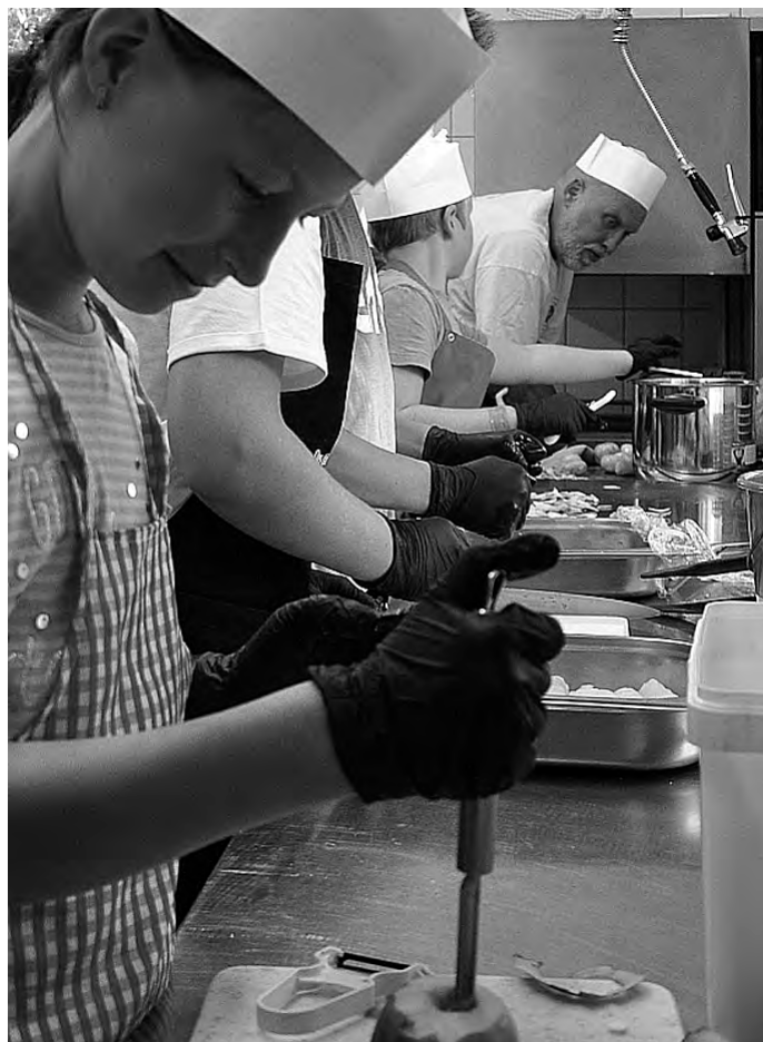
Voller Einsatz in der Vereinsheimküche