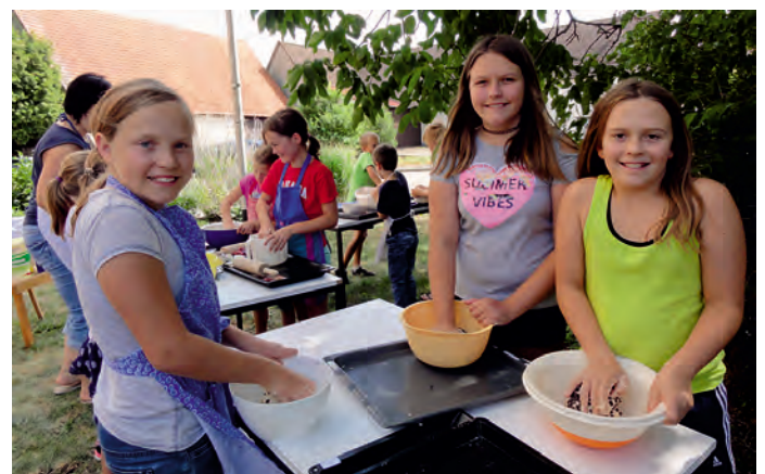
Backen mit den Steinenkircher LandFrauen