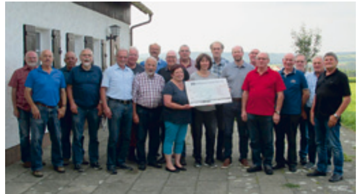
Ein Fahrer und eine Fahrerin fehlen auf dem Foto

Als besonderes Highlight spendeten die Fahrerinnen und Fahrer einen Betrag von 500 € an die Bürgerstiftung Böhmenkircher Alb, die das Bürgermobil maßgeblich mit unterstützt.