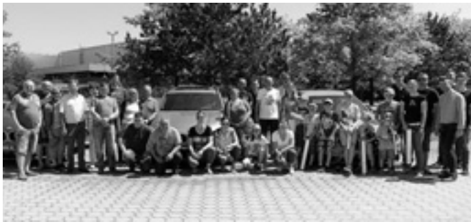
Vor dem BMW-Werk