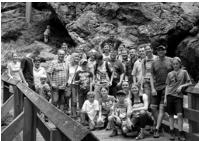
Wanderung bei den Reißloch-Wasserfällen