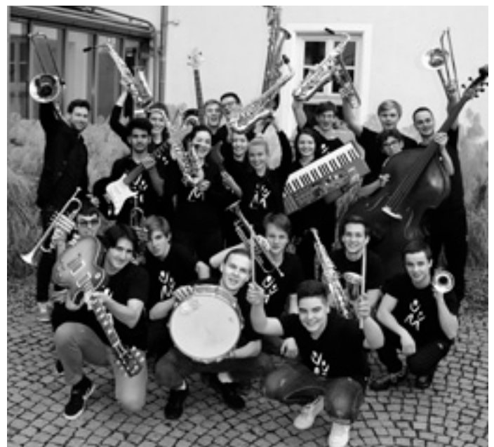
Die Big Energy Band macht mit beim SWR4-Blechduell - in Geislingen!

Für die Gewinner der Vorentscheide geht es am 29. Juni um das Ganze: In Ravensburg spielen sie um den Titel »Mitreißendste Blasmusiker des Landes«. Auf die Band, die das »SWR4 Blechduell 2018« gewinnt, wartet eine professionelle CD-Produktion im Tonstudio des SWR. SWR4 Baden-Württemberg überträgt das Finale live im Programm und per Livestream im Internet.