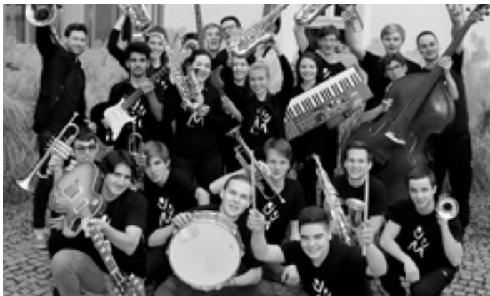
Bühne beb't?! Big Energy Band macht's möglich - auch mit den super Sängerinnen der BK-Sweets!

Eintritt: 12,00 € | ermäßigt: 9,00 € | Mitglieder/Schüler: 6,00 €