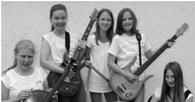
»Vielsaitig« wird's am 17. März im Kapellmühsaal - nicht nur mit der Band »The Strawberries«