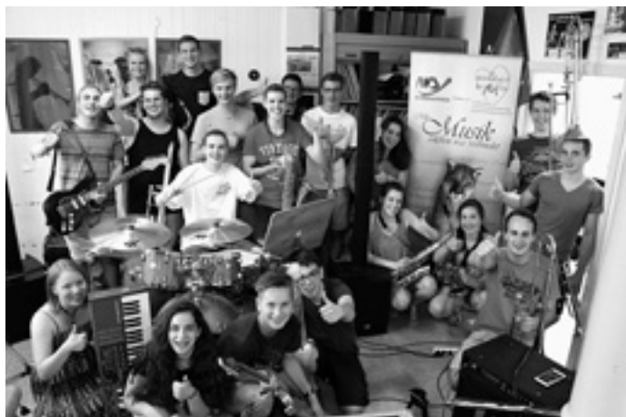
Die Probe-Arbeit der verschiedenen Bands macht jetzt wieder richtig Laune mit neuem Schlagzeug und moderner Verstärkeranlage!

Dank der Firma WS Datenservice, dem Sponsor-Partner des Fördervereins der Musikschule, konnte dieses wichtige Equipment erneuert werden!