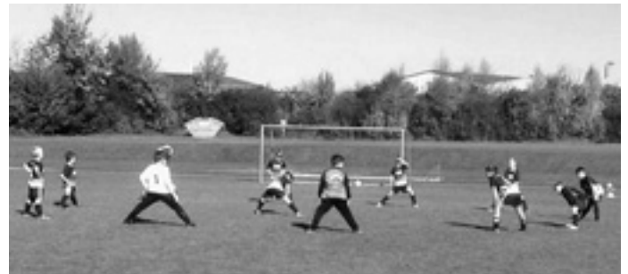
Unsere E-Jugend beim Aufwärmen vor dem Spiel gegen den KSG Eislingen

In der zweiten Spielhälfte hatten sich die KSG'ler nochmal gesammelt und stürmten nun mit neuem Schwung gegen das Böhmenkircher Tor. Der Erfolg des Einsatzes blieb nicht aus und somit erzielte der Gegner in der 40. Spielminute den Anschlusstreffer zum 4:1. Unsere Spieler ließen sich jedoch nicht aus der Ruhe bringen und schossen aus allen Lagen auf das Tor der Eislinger so, dass beim Abpfiff des Spieles ein eindeutiger Sieg von 8:1 Toren und drei weiteren Punkten für die TG Böhmenkirch zu verzeichnen waren.