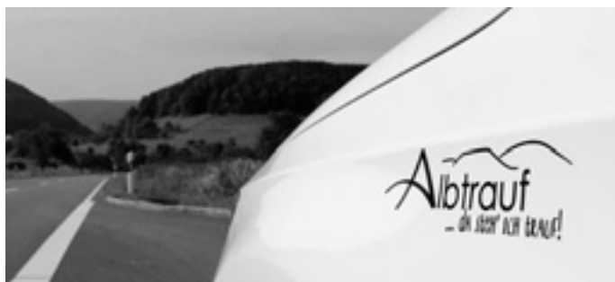
Neue Albtrauf-Autoaufkleber der Erlebnisregion Schwäbischer Albtrauf

Die Autoaufkleber sind in schwarz und silber für 2,10 Euro in der Albtrauf-Geschäftsstelle erhältlich.