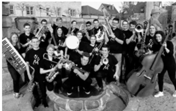
Die Big Energy Band wird bei gutem Wetter am Sonntag, den 7. Mai im Kurpark Bad Überkingen loslegen.

Das Konzert findet nur bei gutem Wetter statt. Der Eintritt ist frei.