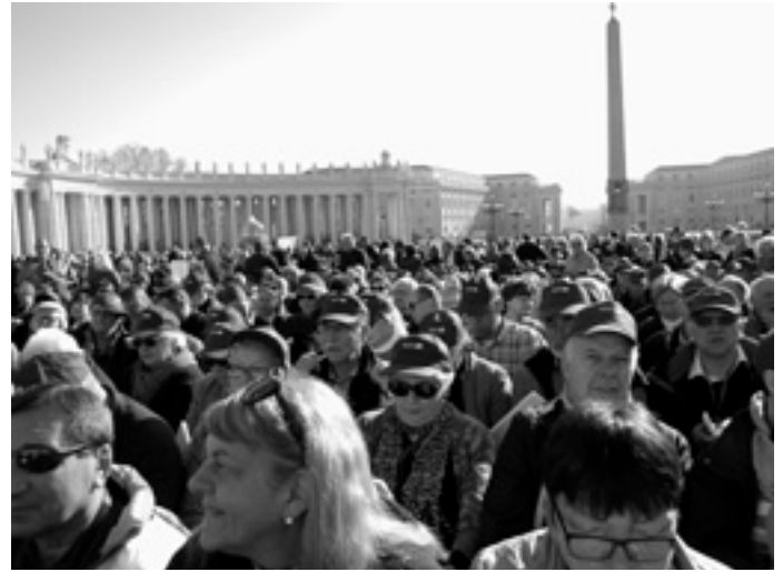
Papstaudiienz auf dem Petersplatz in Rom. 350 Chorsängerinnen und Chorsänger mit blauen Mützen sind weder zu übersehen noch zu überhören. Eine tolle Stimmung und ein einmaliges Erlebnis.