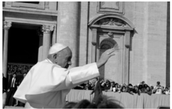
Der Papst ist zum Greifen nah und fährt im Papa-Mobil an den Wallfahrern aus aller Welt vorbei. Auch 350 Chorsängerinnen und Chorsänger des Cäcilienverbandes der Diözese Rottenburg-Stuttgart jubelten ihm zu.