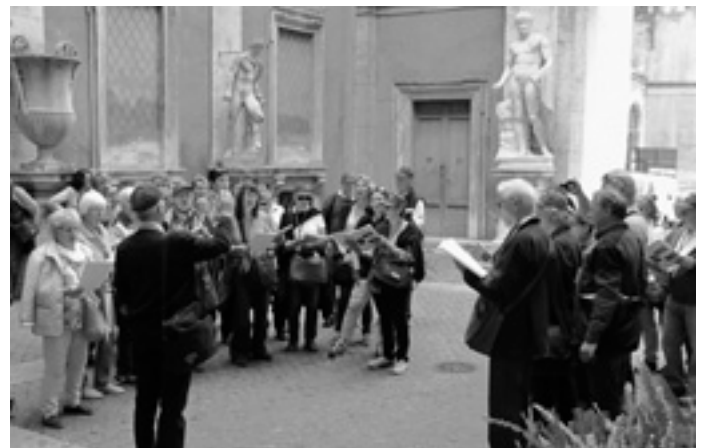
Ein Teilchor des Cäcilienverbandes gibt im Innenhof eines Altstadtgebäudes eine Kostprobe seines Chorgesanges. Daraufhin öffneten sich Fenster und viele Zuhörer waren begeistert.