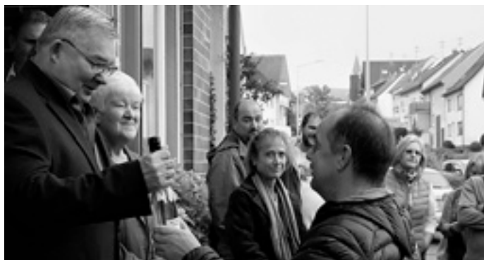
Ein kleines Geschenk vom Verein.