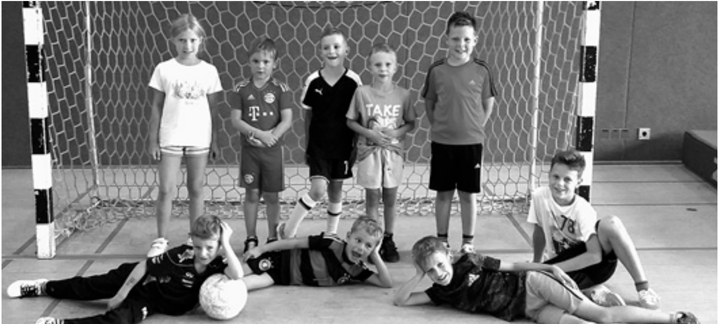
Spielefest in der Alb-Sporthalle