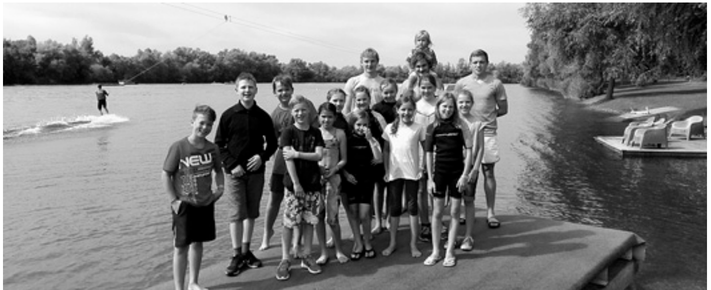
Wasserski & Wakeboard fahren mit dem Freien Jugendclub am Gufisee