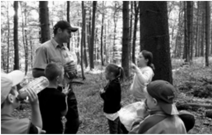
Mit dem Förster im Wald