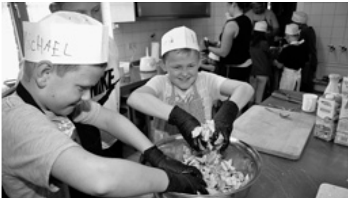
Kochen mit den Gartenfreunden Böhmenkirch