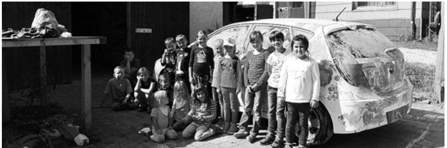
Auto bemalen mit Fingerfarben und dem Freien Jugendclub