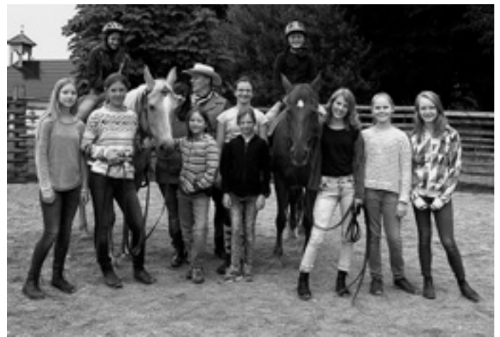
Westernreiten auf der Circle-S-Ranch