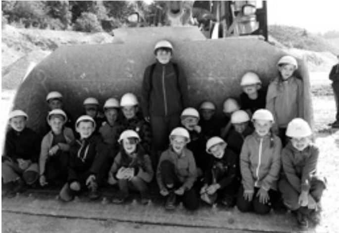
Betriebsbesichtigung unseres Steinbruchs