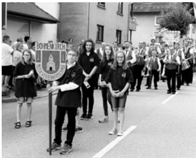
Kinderfest in Geislingen: