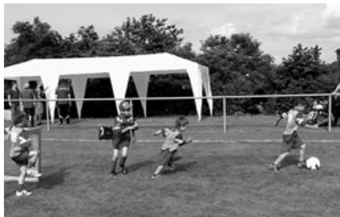
Die jüngsten TG Fußballer die Bambini - Mannschaft in Aktion

Es ist schon wieder ein paar Wochen her, seitdem die Fußballabteilung am Wochenende des 09. und 10. Juli ihr 50 jähriges Bestehen feierte. Begonnen wurden die beiden im Namen des Fußballs stehenden Tage durch Spiele aller TG Mannschaften: