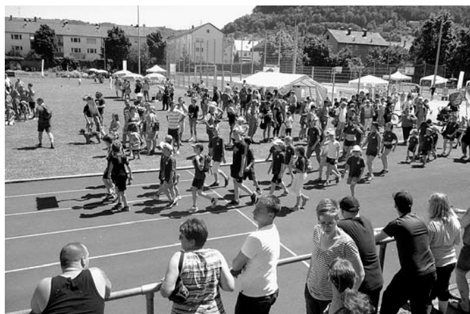
Auch die Kinder des Mutterkind-Turnens und der Turngruppe 3-4-jährigen absolvierten erfolgreich den Spiel-Parcour.

Die Plätze 1 - einschließlich 7 haben sich für die Gaubesten am 24.09.2016 qualifiziert.