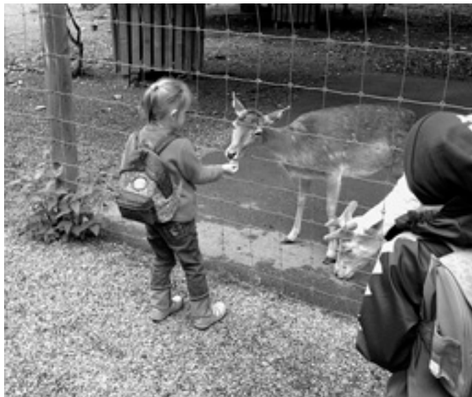
Eine brave Hirschkuh bekommt zuerst ihr Futter

Höhepunkt des Ferienprogramms war der Ausflug in den Wildpark Eichert am Mittwoch. Mit dem Bus fuhren dreißig Kinder und ihre Erzieherinnen nach Heidenheim und wanderten den steilen Schlossberg hinauf. Begrüßt wurden sie von den Mufflons, die natürlich schon auf Futter warteten. Da hieß es also erstmal Anstehen am Futterautomat, was reibungslos klappte.