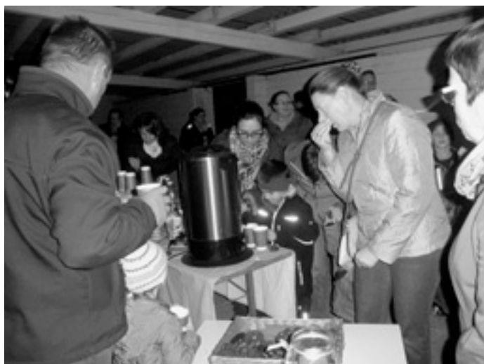
Glühwein und Punsch schmecken gut