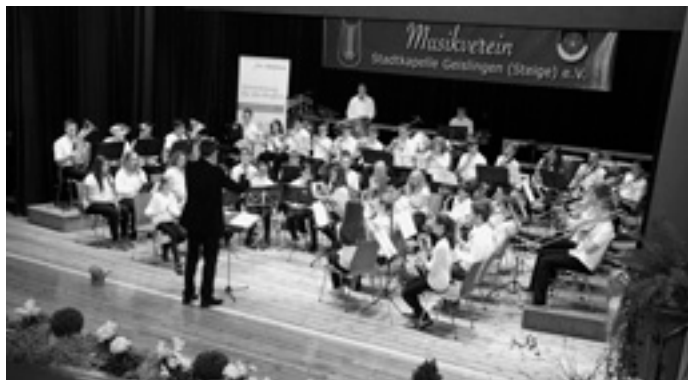
Das Kooperationsorchester wird wieder das Herbstkonzert eröffnen und hat dafür schon fleißig geübt!