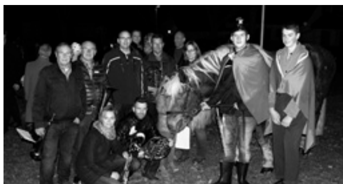
Die Musiker mit St. Martin und Bettler.

Danach ging der Laternenumzug über die Brommstraße, Poststraße und Blumenstraße zurück zum Jugendheim, wo der Abschluss stattfand.