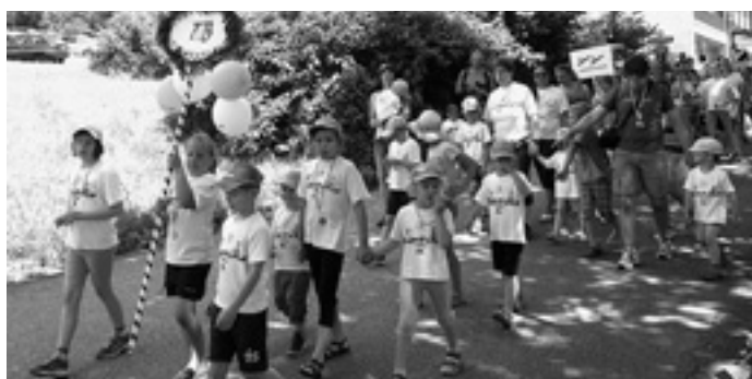
Aufstellung für den Einmarsch