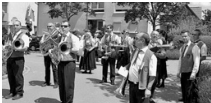
Die Musiker kurz nach der Aufstellung.

Am vergangenen Sonntag begleiteten die Musiker den Umzug zum 65. Kreisfeuerwehrtag in Gingen.