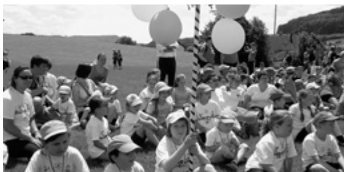
Warten auf die Tanzvorführung