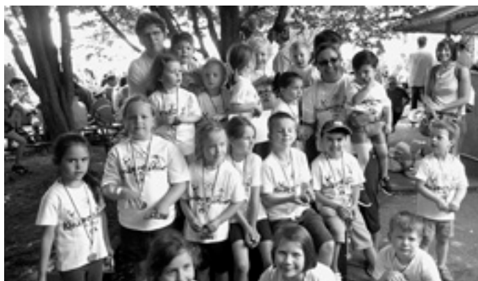
So sehen glückliche Sieger aus