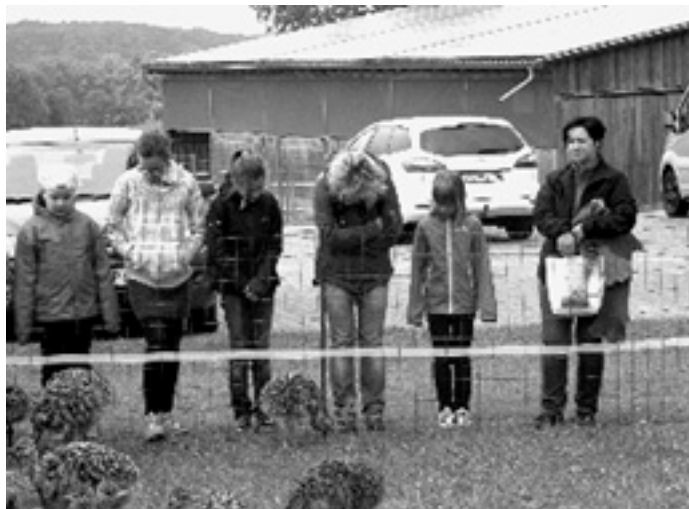
Ein herzliches Dankeschön an Familie Bosch für ihre Mühen.

Am Nachmittag genossen Eltern, Großeltern und Freunde die schönen Liedvorträge der Kinderchöre.