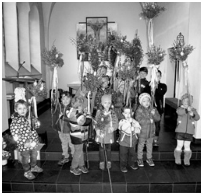
Am 28. und 29. März 2015 gestalteten die Kinder vom Kindergarten St. Vitus und St. Johannes den Palmsonntagsgottesdienst mit.