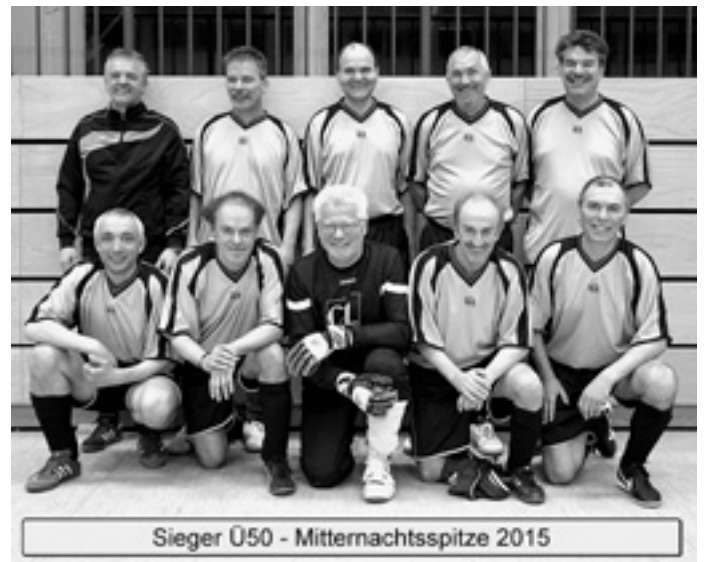
Sieger Ü50 - Mitternachtsspitze 2015