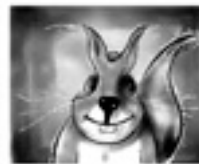
Midi Hörnchen (Stralsche)

Am Mittwoch vor den Faschingsferien wurden die Schülerinnen und Schüler unserer 3. und 4. Klassen von den Grundschulern aus Treffelhausen eingeladen. Auf dem Programm stand ein Stück der Theaterproduktion Nimmerland: