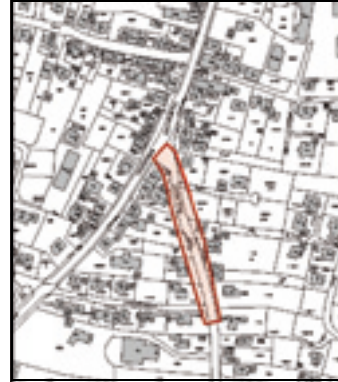
Sanierungsbereich Ulmer Weg BMA Böhmenkirch

Wir bitten um Beachtung und Verständnis für die auftretenden Behinderungen.