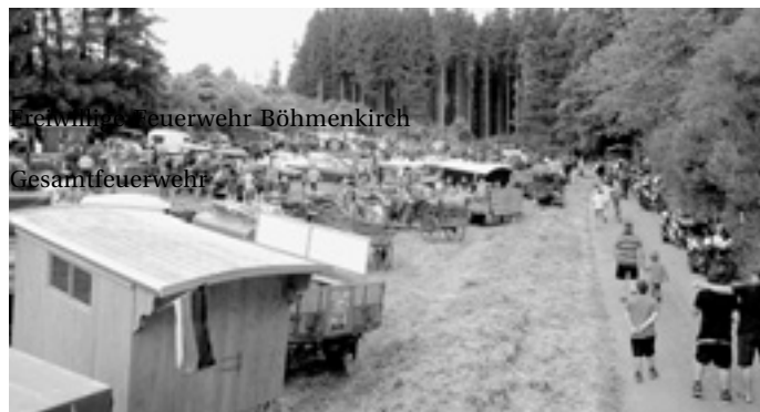
Freiwillige Feuerwehr Böhmenkirch

Oldtimerfreunde und Schützenverein Böhmenkirch