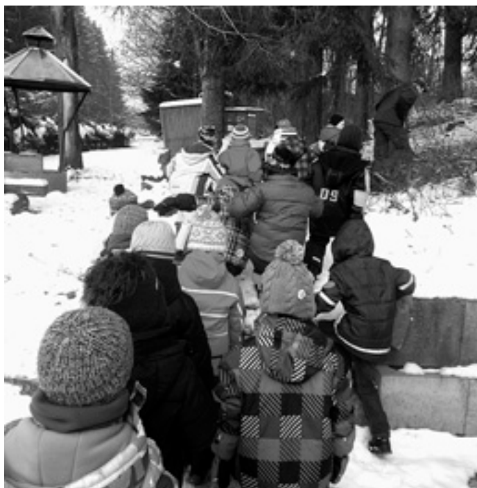
Im Gänsemarsch den Hang hinauf

Nun marschierte die Gruppe, immer im Gänsemarsch, den Hang hinter dem Schützenhaus hinauf, um die ersten Spuren zu entdecken. Schon nach kurzer Zeit waren die Spuren von Rehen zu sehen.