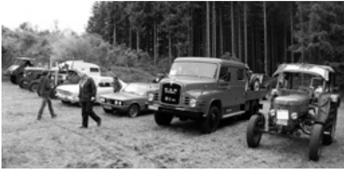
Unimog, Traktor, LKW und PKW in einer Reihe