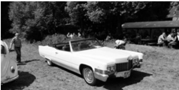
für den Sommer, Cabrio!