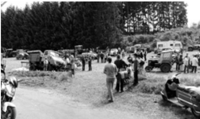
Jung und Alt beim schauen und fachsimpeln

nen, welches H. Bikert freundlicherweise vorführte. Er fertigte aus unförmigen Stämmen mit Präzision Kanthölzer. Für die Stromversorgung hatte freundlicherweise das Alb Werk ein Aggregat zur Verfügung gestellt.