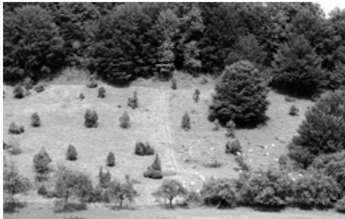
Die Ziegen der Weidgemeinschaft auf einer Umtriebsweide. Links abgeweidet, rechts in Beweidung.

angebrachten Drahtlitzten an Pfosten und in Ausnahmefällen an Bäumen angebracht und unter Strom gesetzt. Die einzelnen Beweidungsflächen werden dann in der Regel ein- bis zweimal im Jahr für maximal zwei Wochen intensiv beweidet, um den Bewuchs mit Ausnahme der Wacholdersträucher, Silberdisteln und ähnlichen landschaftstypischen Pflanzen zu unterdrücken. So werden die Wacholderheiden langfristig in ihrem Bestand erhalten und dienen dem Tourismus in der Erlebnisregion mit ihren Schaf- und Ziegenherden als besonderes Highlight.