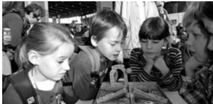
Auf der Spielemesse