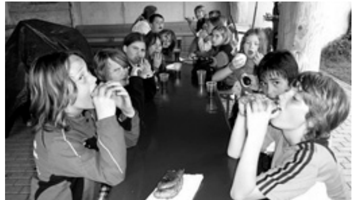
Im Schullandheim schmeckt's prima

Nach einer ausgiebigen Wanderung am Montag zur Hägeles- und Brunnenklinge folgte am Dienstag der Ausflug in den Schwabenspark - von den Kindern als Höhepunkt des Aufenthaltes betrachtet. Den Abend beschloss man beim Grillen mit dem Herbergsvater, Herrn Kugler.