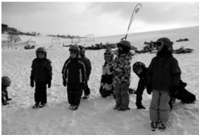
Spaß im Schnee

Später trafen sich alle zum Punsch trinken und Butterbrezel essen in der Hütte. Für die Bewirtung hatte wieder die Bäckerei Schmid gesorgt, die Kosten übernahm der Elternbeirat. Vielen Dank dafür!