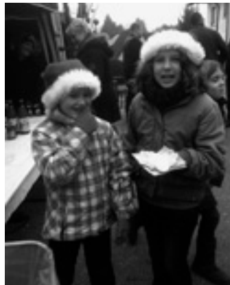
Wir verkaufen für unser Schullandheim