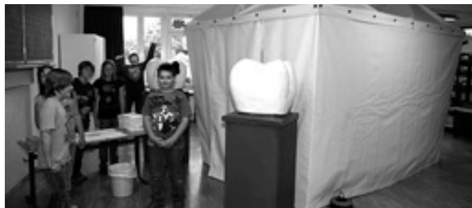
Der begehbare Zahn