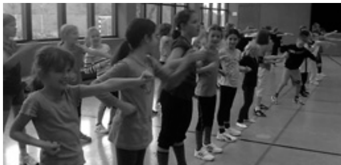
Karate ist lustig