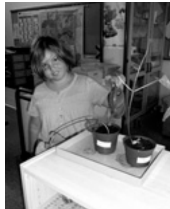
Unsere Feuerbohnen werden riesig