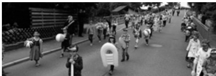
Fit und sportlich auf der »Musiker-Party«