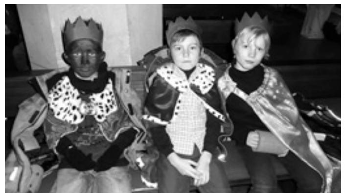
Die Heiligen 3 Könige Denis, Simon, Sören

Das Krippenspiel in seiner ursprünglichen traditionellen Form blieb unverändert - neu waren die modernen, mitreißenden Weihnachtslieder, die in ausdrucksvoller Weise im Gedächtnis bleiben. »Denn der Engel hat gesagt, wie ihr alle wisst, dass der Himmel heute Nacht die Erde küsst«, viele Stimmen aus der Gemeinde unterstützten die Kinder bei diesem wundervollen Weihnachtslied. Sicher kommt es nicht so oft vor, dass in der Kirche spontaner Beifall gesendet wird für ein Krippenspiel, für die musikalische Begleitung (Flöten, Geiger und Bläser) sowie für fast unbekannte Weihnachtslieder!