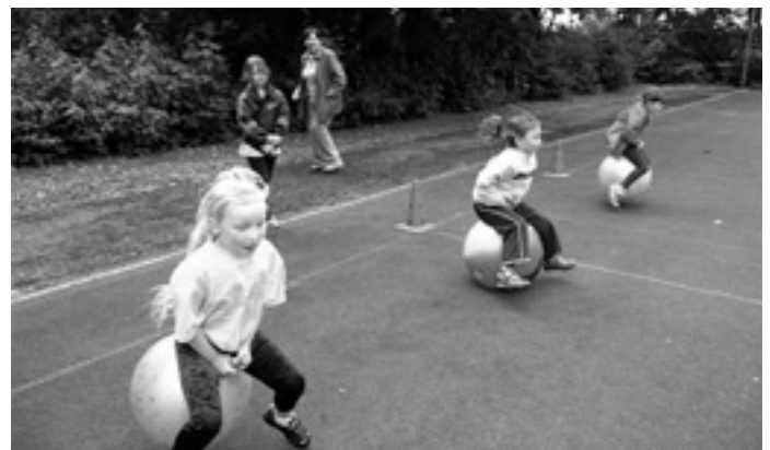
Olympiade - wer wird 1.?

Im Anschluss an diese anstrengende Aufwärmphase durften sich alle bei der »Olympiade« austoben. In Kooperation mit Peter Aigner entstanden sehr ansprechende Stationen, an denen gehüpft, geworfen und gesprungen werden konnte.