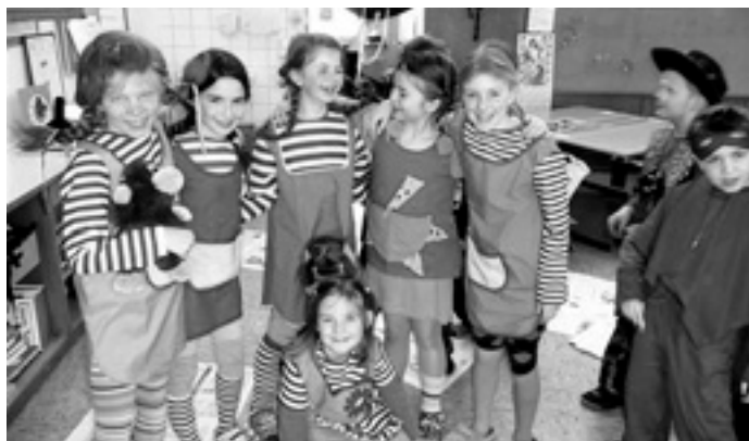
Lauter »Pippis« beim Fasching