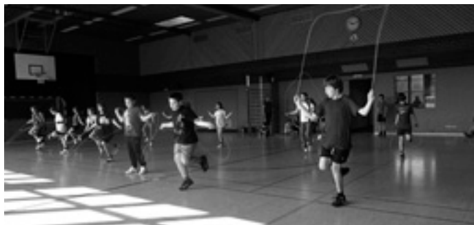
Auch Jungs können Seilspringen

Der Workshop wurde abgerundet mit einer Vorführung. Anschließend durften Eltern und alle anderen Schüler selbst das »Rope Skipping« ausprobieren.