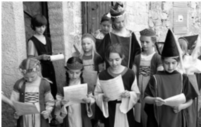
Die Herrschaften auf Burg Katzenstein

Einen Ausflug der besonderen Art unternahmen die Klassen 2 und 3 im Juni - es ging zur Burg Katzenstein bei Dischingen. Dort erlebten die Grundschüler »Geschichte« - original gewandt konnten sie den Burg-alltag und den Aufbau dieses »Hofstaates« spielerisch erfahren. Im Laufe der Besichtigung kamen die einzelnen Rollen