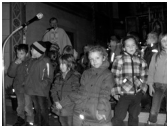
Der Kindergarten St. Vitus feierte das Martinsfest