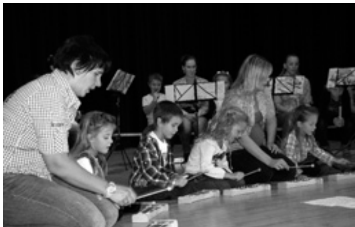
Die »Musi-kids« aus Treffelhausen waren mit Eifer dabei den Ton richtig zu treffen. »Der hüpfende Zeigefinger« mit Flötengruppe.