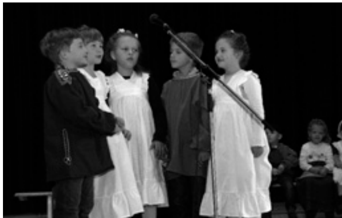
Ehemalige Kindergartenkinder aus Steinenkirch tragen das »Steinenkircher Gedicht« vor. Dafür gab es viel Applaus.

Dabei ging der Schultes auf die wichtigsten Highlights in den einzelnen Ortsteilen ein. Er erwähnte dabei die Eigenleistung der Schnittlinger Bevölkerung beim Bau eines Friedhofswegs aber auch die Investitionen bei der Ausstattung der Roggentalhalle in Treffelhausen. Auch das »Große Lautertaler Musikertreffen fand dieses Jahr in Treffelhausen statt und wurde von der Original Schwäbischen Trachtenkapelle gestemmt.