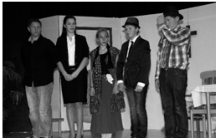
Schlussapplaus für die Jugendgruppe der Laienspieler Böhmenkirch mit dem Schwäbischen Schwanke »Des bissle Haushalt«.