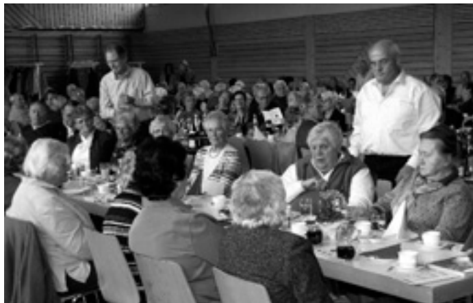
Die Besucher des Seniorennachmittags wurden von Gemeinde, Ortschaftsräten und Kirchengemeindeführern bestens bewirtet.

In Steinenkirch hat die Gemeinde Geld in die Hand genommen, um das Dorfhaus und die Inneneinrichtung zu sanieren.