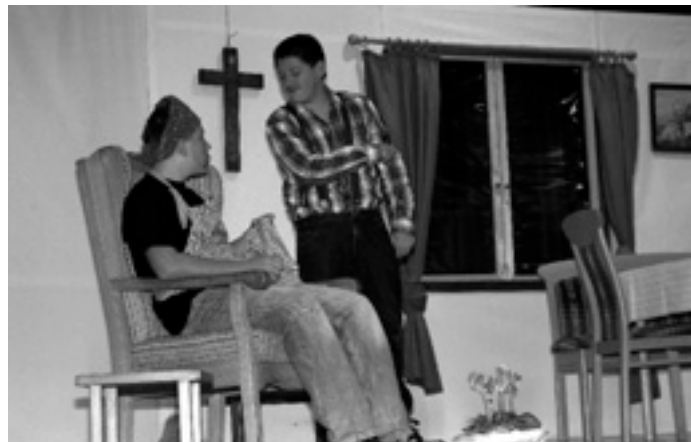
Theater um »Des bissle Haushalt« gab es von »D'Vorhanggucker«. Die Jungdarsteller waren voll bei der Sache.