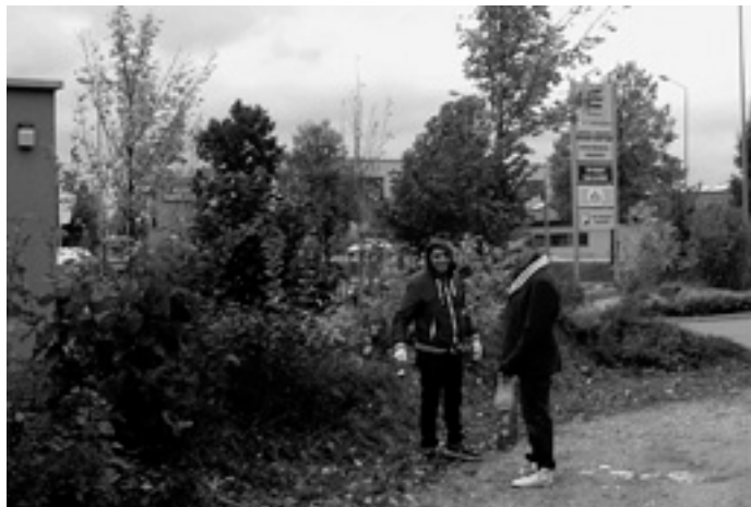
Die engagierten Helfer vom Jugendraum füllten so manche Mülltüte

In den letzten beiden Wochen waren viele fleißige Helfer am Werk, um unsere schöne Landschaft, die Grillplätze, sowie die Spiel- und Sportplätze vom Müll zu befreien. Zwei Klassen aus der Werkrealschule in Böhmenkirch, der Musikverein Schnittlingen sowie die Jugendlichen vom Jugendraum in Böhmenkirch halfen bei der Sammelaktion mit.