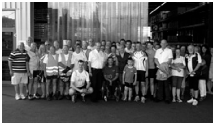
Scheckübergabe der Kreisradrundfahrt 2012

Bei der Ankunft der gut 40 Radler um den Bundestagsabgeordneten Klaus Riegert bei der Kreisvereinigung Leben mit Behinderung e.V. in der Beethovenstr. 48/1 in Süßen, der traditionellen Endstation der Kreisradrundfahrt, war die Spannung letzten Freitag groß. Schließlich wollte man nun wissen, wie groß die Summe ist, die dem Stationären Hospiz zugute kommen soll. Über 280 km mit mehr als 30 Stationen hatte da die gut gelaunte Truppe vom 30. 7. bis zum 3. 8. 2012 zugunsten der guten Sache zurückgelegt. Und das Ergebnis kann sich sehen lassen: 20.170 € standen auf dem Scheck, der dem sich im Bau befindlichen Hospiz zugeordnet ist.