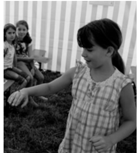
Ein Tag beim Imker