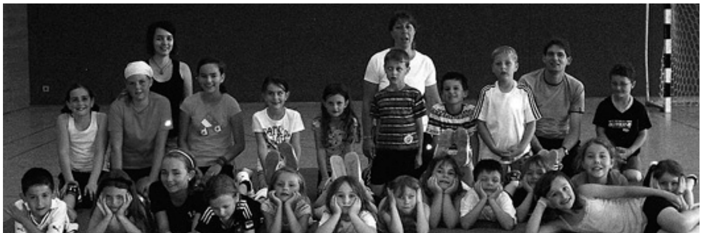
Spielfest in der Alb-Sporthalle