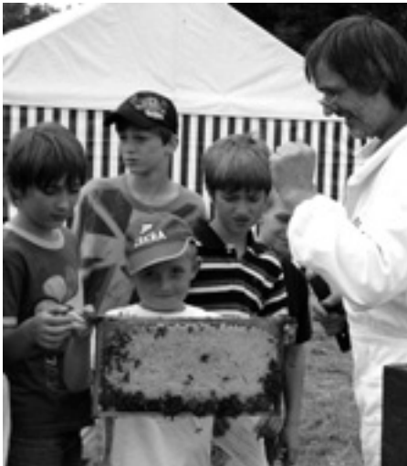
Ein Tag beim Imker