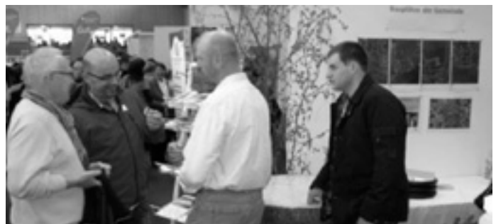
Am Sonntagnachmittag war der Besucherandrang groß