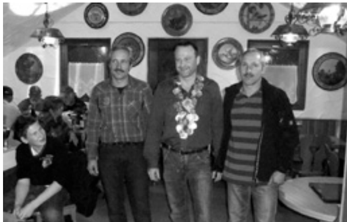
Schützenkönig mit ersten und zweiten Ritter