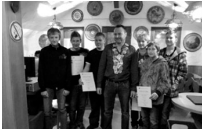
Schützenkönig mit Schützenjugend