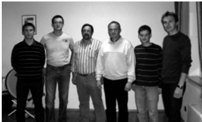
Die neue Führungsriege des Musikvereins Schnittlingen:

Somit wird der Verein nun von einer Doppelspitze geführt. Wir wünschen der neuen Führungsriege alles Gute und viel Erfolg in Ihrem neuen Amt.