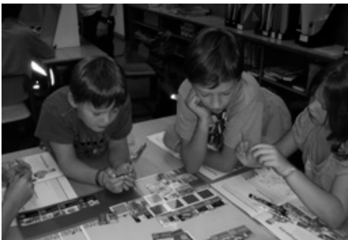
Wie könnten wir Energie sparen?

Mit EDe Hilfe überlegten sich die Schülerinnen und Schüler, wie man in Zukunft fossile Brennstoffe wie Kohle, Erdöl und Erdgas durch erneuerbare Energien ersetzen kann. Die Kinder lernten die Kraft von Wasser und Wind kennen und machten sich mit der Fotovoltaik vertraut.