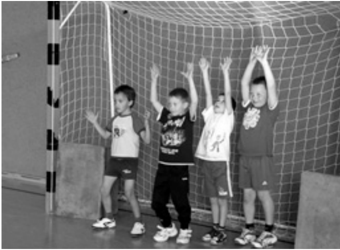
»Mir lassat koi Tor vom Oli neil!«

Ein herzliches Dankschön den beiden Handballern des TVTs, die den Vormittag für die Kinder sehr interessant und ideenreich gestalteten und damit auch dazu beigetragen haben, dass sich so manches Handballtalent schon in jungen Jahren beim Verein einfinden kann.