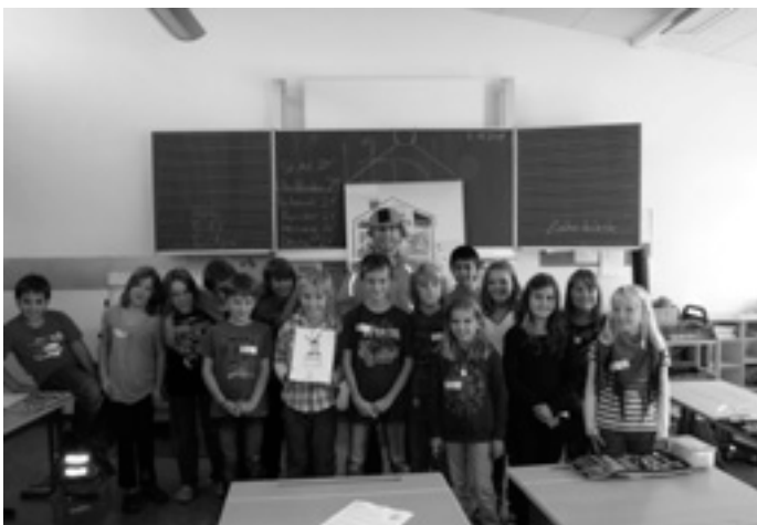
Wir sind jetzt alle Energie-Detektive

Mit Spaß und Spannung waren die Viertklässler der Grundschule Treffelhausen am Dienstagvormittag der Energie auf der Spur. Mit einem Koffer voller Erfahrungen und spannender Experimente erkundete EDe, der Chef-Energie-Detektiv, mit den Kindern die Welt der Energie von heute und morgen. Im Auftrag des Ministeriums für Umwelt, Klima und Energiewirtschaft bildete er die Schülerinnen und Schüler zu Junior-Energie-Detektiven aus. Zunächst veranschaulichte aktiver körperlicher Einsatz an einem Kurbelgenerator der Klasse den Begriff Energie.