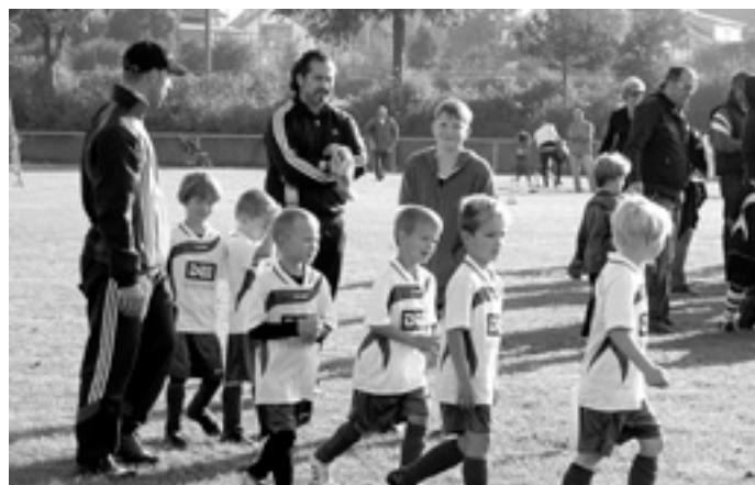
TG Mannschaft beim Einlaufen zum Spiel

Die beiden Spiele finden in Hausen statt. Kommen und unterstützen Sie unsere beiden Mannschaften bei diesem Auswärtsspiel.