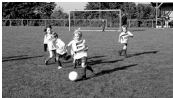
TG Mannschaft beim Angriffspiel

Nur eine Woche später waren die jüngsten TG Spieler wieder am Start. Diesmal fand der Spieltag in Aufhausen statt. Und bei nur einem Unentschieden und drei Siegen konnte man die Begegnungen sogar noch erfolgreicher gestalten als zuhause.