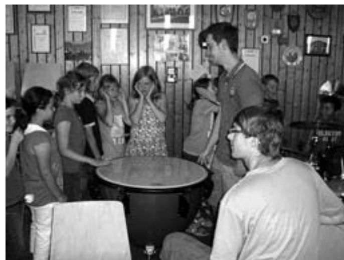
Am Schlagwerk ging es laut her.